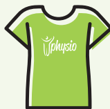
T-SHIRT € 15,00