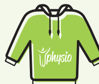
FELPA CON CAPPUCCIO € 40,00