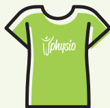
T-SHIRT TECNICA € 20,00